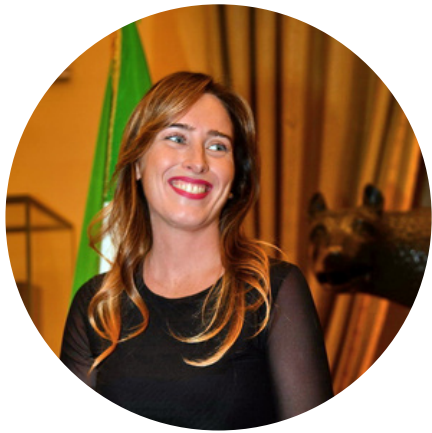
Maria Elena Boschi

Deputata, Vicepresidente Commissione di Vigilanza RAI