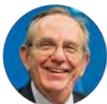
Pietro Carlo Padoan Presidente di UniCredit