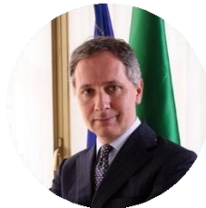
Saverio VALENTINO Componente dell'Autorità Garante della Concorrenza e del Mercato