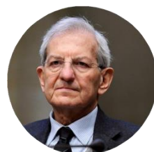
Luciano Violante Presidente Fondazione Leonardo – Civiltà delle Macchine