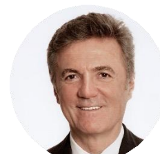
Flavio Cattaneo Amministratore delegato ENEL; Vice Presidente di Italo- Nuovo Trasporto Viaggiatori