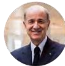
Corrado Passera Fondatore e CEO di Illimity