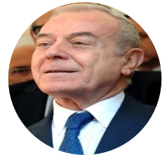
Gianni Letta Presidente di Civita