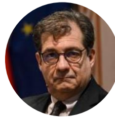
Francesco TALÒ Ambasciatore e già Consigliere Diplomatico del Presidente del Consiglio