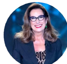
Cesara Buonamici Direttore ad personam del TG5 Mediaset