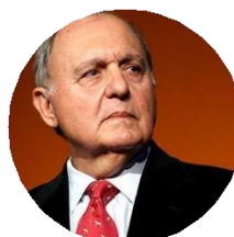
Paolo Savona Presidente della CONSOB