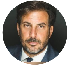
Federico CORNELLI Commissario della CONSOB