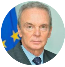
Ferdinando Nelli Feroci Presidente di IAI