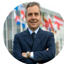
Dario Scannapieco AD Cassa Depositi e Prestiti