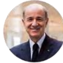
Corrado Passera Fondatore e CEO di Illimity