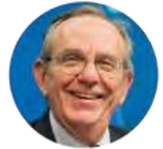
Pietro Carlo Padoan Presidente di UniCredit