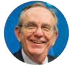
Pietro Carlo Padoan Presidente di UniCredit