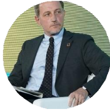
Massimo Giannini Scrittore e Giornalista