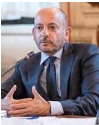
A.De Palmas,V.P. Microsoft P.S.