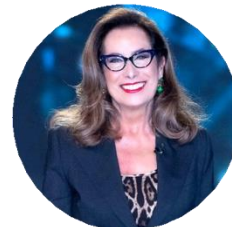
Cesara Buonamici Direttore ad personam del TG5 Mediaset