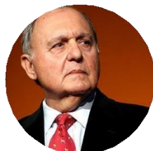
Paolo Savona Presidente della CONSOB