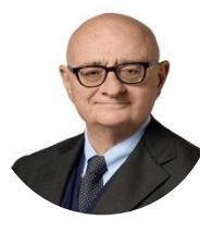
Vincenzo Nunziata Presidente di Aeroporti di Roma