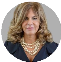
Emma Marcegaglia Presidente e AD Marcegaglia Holding.