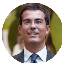
Giovanni Floris Giornalista e Conduttore TV