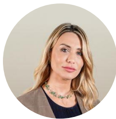
Chiara SGUBIN Segretario Generale di Telespazio