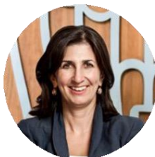
Marcella Panucci Capo di Gabinetto Ministero dell'Università e della Ricerca