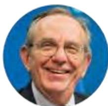
Pietro Carlo Padoan Presidente di UniCredit