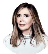
Maria Latella Giornalista e Scrittrice