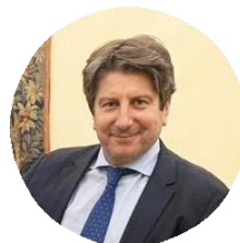
Giuseppe Recinto Capo di Gabinetto Ministero dell'Istruzione e del Merito