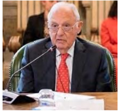
P.Savona, Presidente di CONSOB