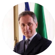
Saverio VALENTINO Componente dell'Autorità Garante della Concorrenza e del Mercato