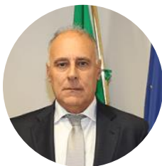
Maurizio VALLONE Direttore della Scuola di Perfezionamento per le Forze di Polizia