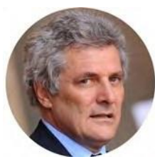
Alain Elkann Scrittore e giornalista