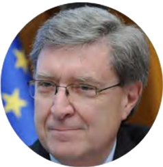
ENRICO GIOVANNINI PRESIDENTE