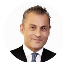
Pasqualino Monti Amministratore delegato di ENAV