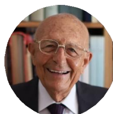
Sabino Cassese Costituzionalista