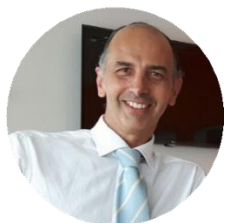
Federico Eichberg Capo di Gabinetto Ministero delle Imprese e del Made in Italy