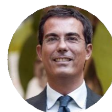
Giovanni Floris Giornalista e Conduttore TV