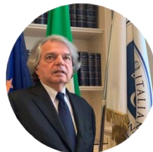
Renato Brunetta Presidente del CNEL