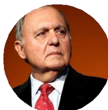
Paolo Savona Presidente della CONSOB