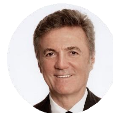
Flavio Cattaneo Amministratore delegato ENEL; Vice Presidente di Italo- Nuovo Trasporto Viaggiatori