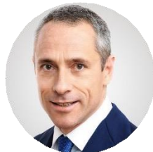
Matteo Del Fante Amministratore delegato e Direttore Generale di Poste Italiane