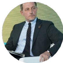
Massimo Giannini Scrittore e Giornalista