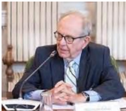
P.C. Padoan, Presidente di Unicredit