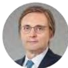
Massimo Tononi Presidente Banco BPM