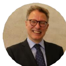
Luciano Floridi Professor and Founding Director of the Digital Ethics Center, Yale