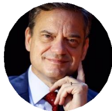
Lorenzo Bini Smaghi Presidente di Société Générale