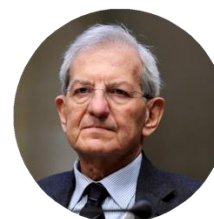
Luciano Violante Presidente Fondazione Leonardo – Civiltà delle Macchine