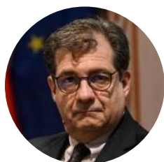
Francesco TALÒ Ambasciatore e già Consigliere Diplomatico del Presidente del Consiglio