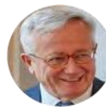
Giulio Tremonti Presidente di Aspen