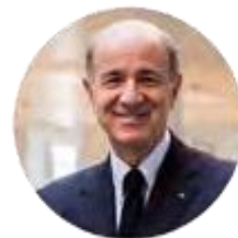
Corrado Passera Fondatore e CEO di Illimity