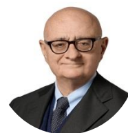
Vincenzo Nunziata Presidente di Aeroporti di Roma