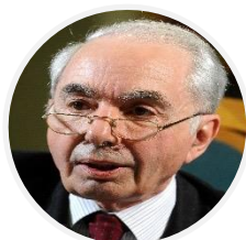
Giuliano Amato Presidente emerito della Corte Costituzionale

L'Alto Consiglio svolgerà tutti i compiti relativi alla funzione di indirizzo strategico-didattico e di orientamento mediante la stesura annuale di alcune linee guida per il percorso di alta formazione.