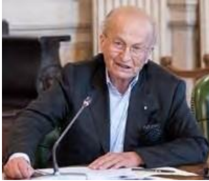
M.Sella, Presidente di Banca Sella