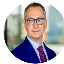
Luca Tagliaretti Direttore esecutivo dell'European Cybersecurity Competence Centre