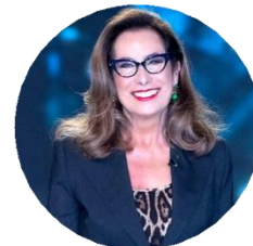
Cesara Buonamici Direttore ad personam del TG5 Mediaset