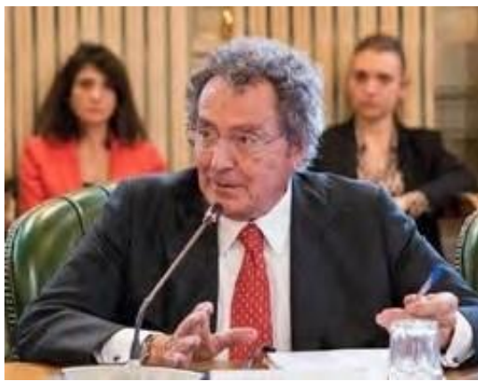
G.M. Gros-Pietro, Presidente di Intesa Sanpaolo