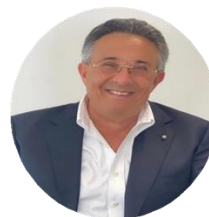
Roberto Sergio Direttore Generale della RAI