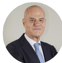
Claudio Descalzi Amministratore delegato di Eni