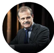
Giampiero Massolo Presidente di Mundys