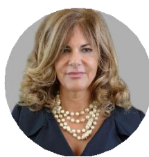
Emma Marcegaglia Presidente e AD Marcegaglia Holding.