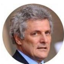
Alain Elkann Scrittore e giornalista