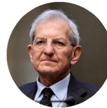
Luciano Violante Presidente Fondazione Leonardo – Civiltà delle Macchine