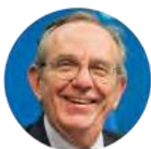
Pietro Carlo Padoan Presidente di UniCredit