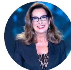
Cesara Buonamici Direttore ad personam del TG5 Mediaset