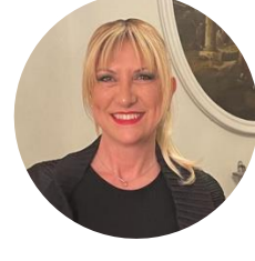
Silvia CASTAGNA Membro della Commissione AI del Dipartimento per l'informazione e l'editoria della Presidenza del Consiglio dei Ministri