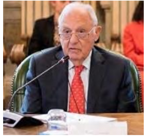
P. Savona, Presidente di CONSOB