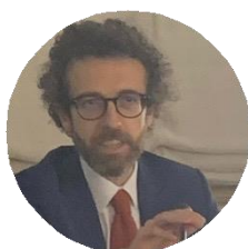
Francesco Gilioli Capo di Gabinetto Ministero della Cultura