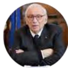
Patrizio BIANCHI Cattedra UNESCO in "Education, Growth and Equality"