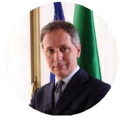
Saverio VALENTINO Componente dell'Autorità Garante della Concorrenza e del Mercato