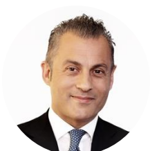
Pasqualino Monti Amministratore delegato di ENAV