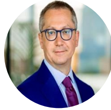
Luca Tagliaretti Direttore esecutivo dell'European Cybersecurity Competence Centre