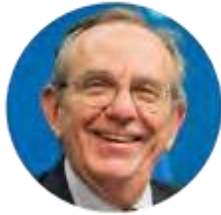
Pietro Carlo Padoan Presidente di UniCredit