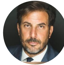
Federico CORNELLI Commissario della CONSOB