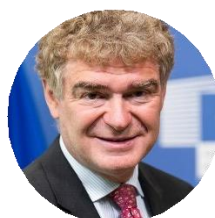
Mario Nava Direttore Generale, DG Occupazione, Affari Sociali e Inclusione in Commissione Europea