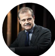
Giampiero Massolo Presidente di Mundys e di ISPI