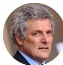
Alain Elkann Scrittore e giornalista