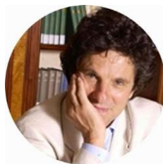
Maurizio VROLI Professor Emeritus of Politics, Princeton University