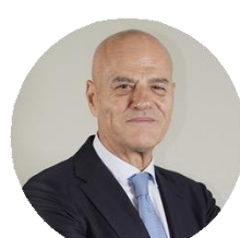
Claudio Descalzi Amministratore delegato di Eni