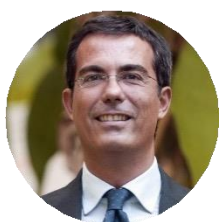
Giovanni Floris Giornalista e Conduttore TV