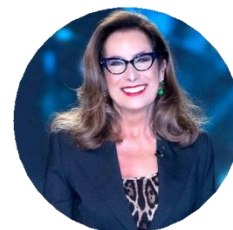
Cesara Buonamici Direttore ad personam del TG5 Mediaset