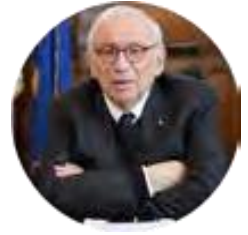
Patrizio BIANCHI Cattedra UNESCO in "Education, Growth and Equality"