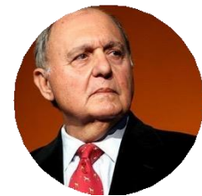
Paolo Savona Presidente della CONSOB