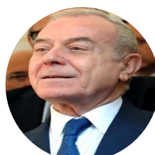
Gianni Letta Presidente di Civita