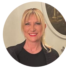
Silvia CASTAGNA Membro della Commissione AI del Dipartimento per l'informazione e l'editoria della Presidenza del Consiglio dei Ministri