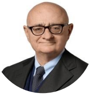
Vincenzo Nunziata Presidente di Aeroporti di Roma