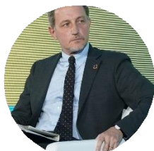
Massimo Giannini Scrittore e Giornalista