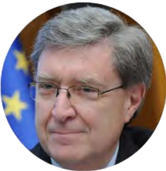
ENRICO GIOVANNINI PRESIDENTE