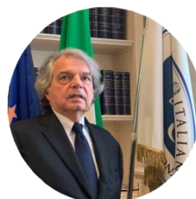
Renato Brunetta Presidente del CNEL