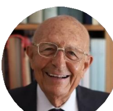
Sabino Cassese Costituzionalista