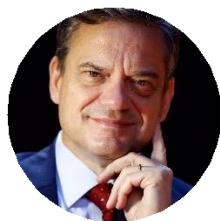
Lorenzo Bini Smaghi Presidente di Société Générale