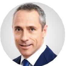
Matteo Del Fante Amministratore delegato e Direttore Generale di Poste Italiane